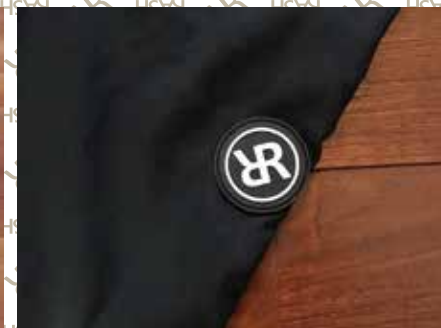
左モモにRサークルマークラバータグ