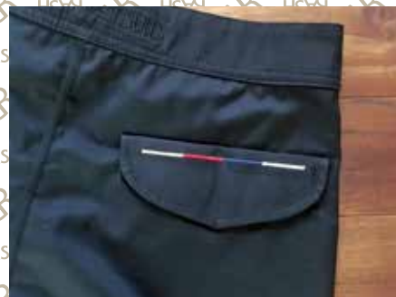
後ポケットに4シーズンカラー刺繍