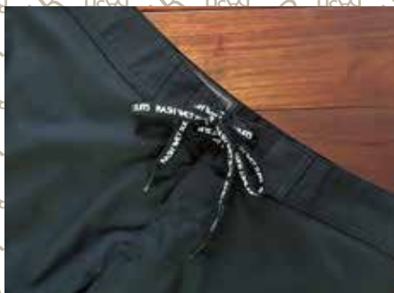
RASHプリント紐を使用